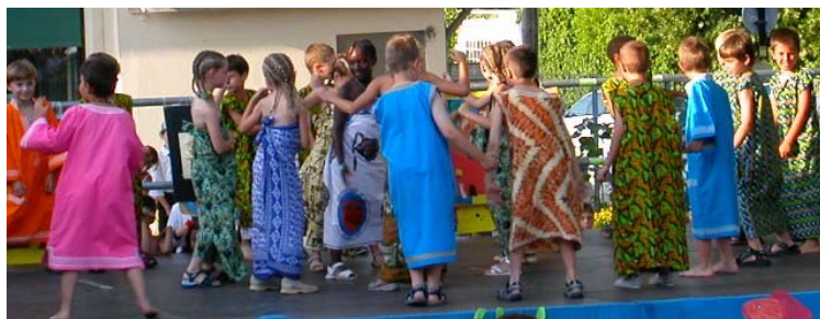
La kermesse à Bordeaux

Le partenariat que nous avons initié et que nous soutenons entre l'école primaire Paul Doumer de Bordeaux et l'école primaire publique de Bolou se renforce au fil du temps. Une vidéo a été tournée par un membre de Déka-Ewé Togo auprès des instituteurs et des élèves de Bolou, et la diffusion de cette vidéo à Paul Doumer a permis aux enfants de mieux percevoir la réalité de la scolarité à Bolou, ce qui a considérablement renforcé leur enthousiasme pour cet échange. Ainsi, la kermesse de fin d'année, où Déka-Ewé France était présente a été organisée sur ce thème.