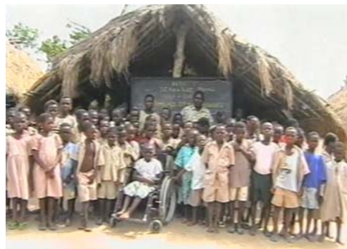
Les écoliers de Bolou

Les enfants de l'école Paul Doumer ont également réalisé une vidéo en réponse à celle envoyée par ceux de l'EPP Bolou.