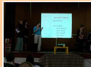
Lors de la présentation de l'école de Bolou

Après l'explication générale sur support de diapositives PowerPoint, le film « Poivre Blanc » a pu être projeté, suivi de plusieurs extraits de l'inauguration de l'école, filmés en février dernier.