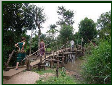
Le pont qui relie Bolou-Agbadomé et Bolou-Gatigblé

Bolou-Gatigblé est un village situé à environ 30 minutes de marche de Bolou-Agbadomé, et doté comme sa voisine d'une école primaire publique, dont les bâtiments ont été financés grâce à l'appui d'une ONG (qui n'a plus d'actions dans le village à ce jour). L'effectif actuel de l'école est de 205 élèves.